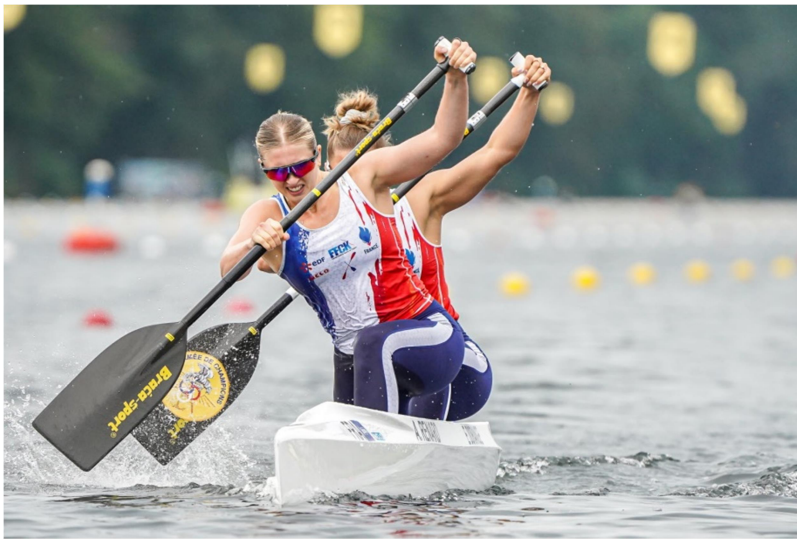
Le canoë sprint est une discipline des Jeux Olympiques 2024