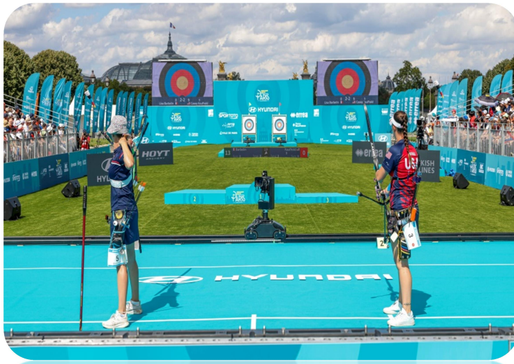
Le tir à l'arc discipline des jeux Olympique 2024