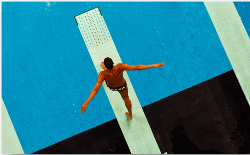
Le plongeon discipline des jeux Olympique 2024