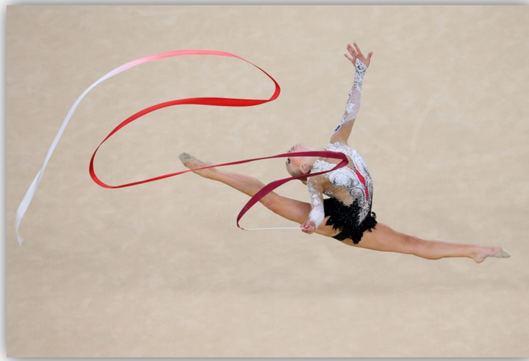
La gymnastique rythmique discipline des jeux Olympique 2024